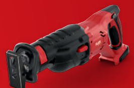
RS 29 18.0 Bestell-Nr. 417.874