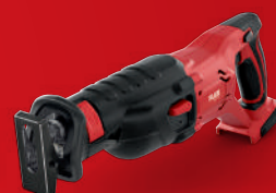
RS 29 18.0 Bestell-Nr. 417.874