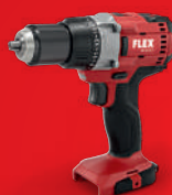
DD 2G 18.0 Bestell-Nr. 417.831