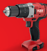
PD 2G 18.0 Bestell-Nr. 417.858