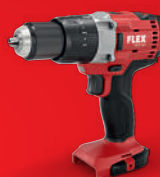
PD 2G 18.0 Bestell-Nr. 417.858